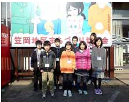
第4期子ども新聞部員

昨年5月から「井笠鉄道」と「遍照寺の多宝塔」をテーマに新聞づくりに取り組み、子ども新聞を3部完成させました。そして活動最終日の3月5日に27年度の閉講式を行って各部員に修了証書を渡しました。この新聞づくりを通じて学んだことや体験を活かしながら、大きく成長してほしいと思います。 なお、新聞は笠岡小学校の3、6年生に配布しており、紙面の都合で、まち協「かさおか」4月号と5月号に分けて掲載しますのでご覧ください。 活動にご協力くださいました皆様 に厚くお礼申し上げます。