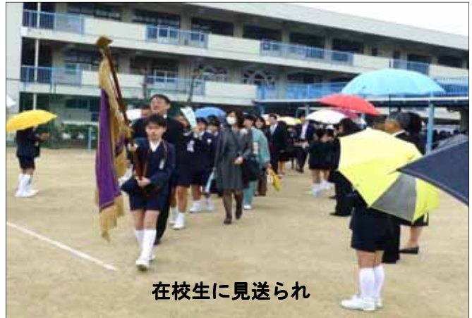
在校生に見送られ

この日の天気予報は“くもりのち雨”ちょうど式が終わった頃にポツポツ降り出し、涙雨の中、見送りも無事に終わりました。