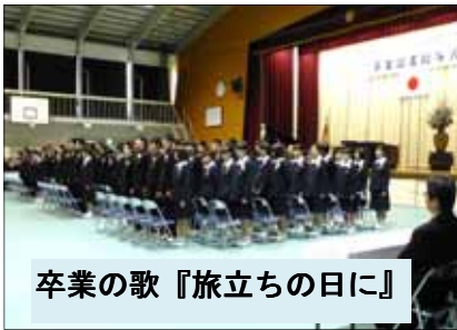
卒業の歌『旅立ちの日に』

3月15日 体育館で第69回卒業証書授与式が行われ、卒業生105名(男子56名、女子49名)が3年間通った学びやを巣立ち、未来へ大きく一步を踏み出しました。