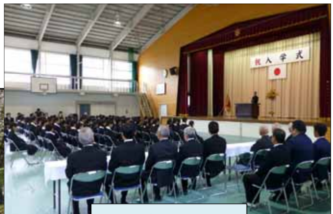
在校生歓迎あいさつ