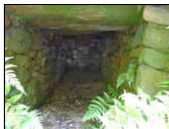
《仙人塚古墳》 竪穴式石かくの内部 肉眼では真っ暗ですが カメラの眼はすごい！

「子ども新聞部活動中」 5月7日から部員4人で新聞づくりに取り組んでいます。 テーマは「郷土館と展示物の紹介」で、6月18日には関戸廃寺と長福寺裏山古墳群に出かけて詳しく調べました。次回7月2日は大飛島の遺跡調査です。