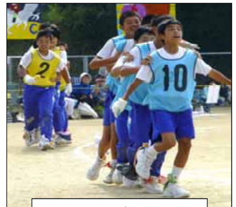
2年 ムカデ ジャパン

蒸し暑い日でしたが、好天に恵まれた9月10日、記念すべき第70回体育会が開かれました。