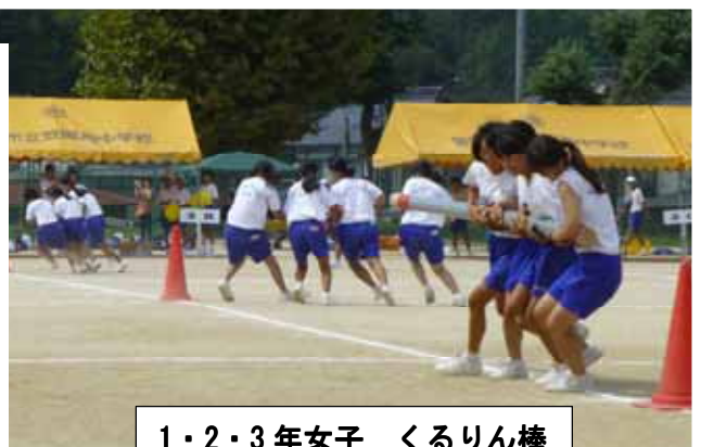
1・2・3年女子 くるりん棒

A(赤色)・B(黄色)・C(青色)の各ブロック対抗による17種目の演技がグラウンド一杯に行われ、手に汗を握る勝負の展開に熱く燃えた1日でした。また、プログラム最後の800mリレーに教職員チームが参加され、第4コーナー付近で教頭先生から校長先生にバトンタッチの瞬間です！