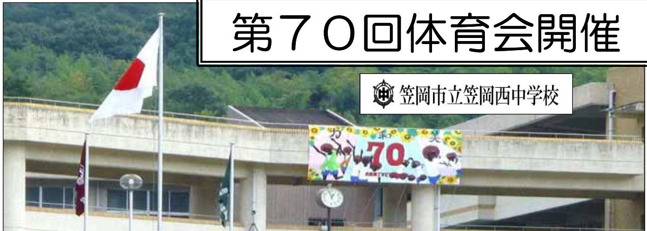
笠岡市立笠岡西中学校