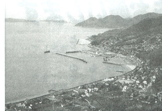
青佐山第一展望台より※正頭漁港方面を望む ※海の見える家=まちづくり拠点予定

注) 希望の事業の部会を選んでください。複数でも結構です。提出済みの方は不要です。8月初旬に部会を開きます。中途で入れられてもよろしいので誘いあわせご参加下さい。