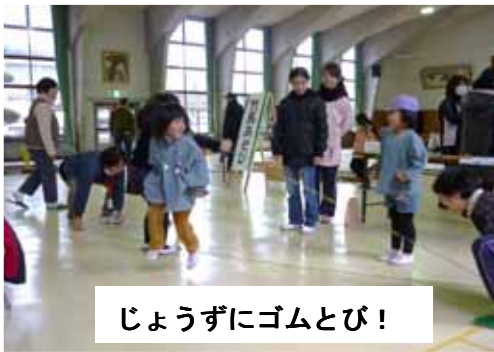
じょうずにゴムとび！

12月20日、昔遊びやじゃんけんゲームを楽しみました。前夜からの雨で来場が心配されましたが、講堂内に子ども達の歓声が響きわたって交流を深め、そして栄養委員さんの昔なつかしい団子汁の味は格別でした。