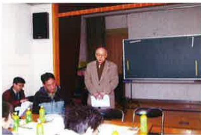
開会のあいさつをする惣津会長