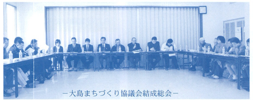
大島まちづくり協議会結成総会

「笠岡市は、住民同士が話し合いで地域課題に対処する地縁組織「まちづくり協議会」の設立を市内全24地区に呼びかけている。」これは、今月はじめに掲載された山陽新聞の記事の1部です。笠岡市は、平成24年度中に全地区設立を目標にして、すでに、陶山・白石島・新山・番町・神島などモデル地区に指定し、準備が進められています。そこで、このたび、大島地区もモデル地区の仲間入りをさせていただきました。今年度は、取り急ぎ体制づくりに取り組んでいます。「笑顔のおおしま」「みんなが主役のおおしま」をモットーに「大島まちづくり協議会」が立ち上がりました。