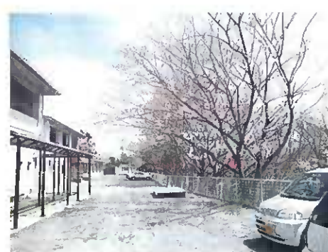
社会福祉施設ときわ