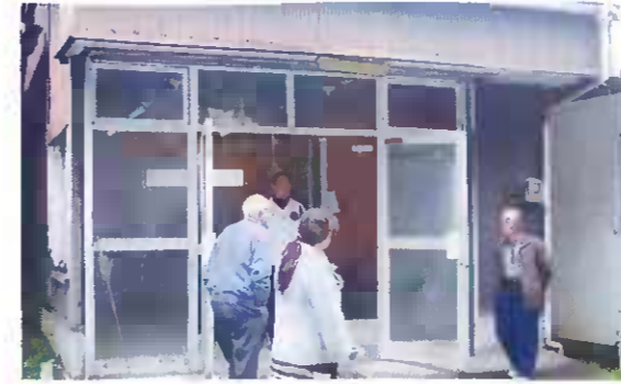
改装前の玄関は（開き戸）だった