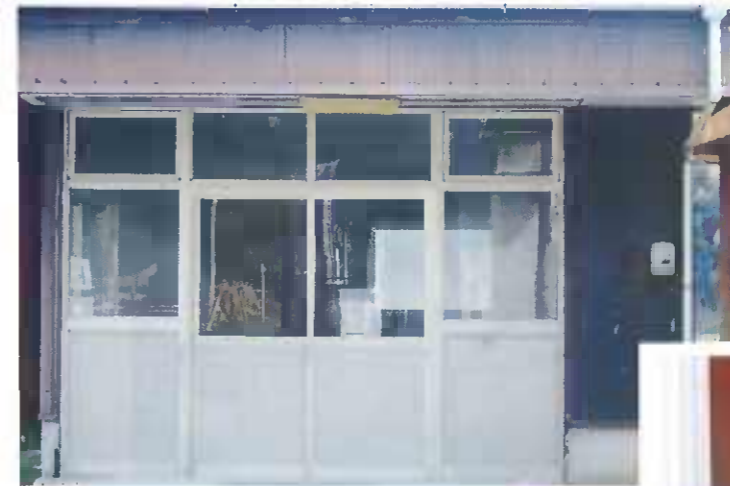
改装後は引き違いの戸になった。

有田集会所と旧消防機庫とに挟まれた旧農協の建物を譲り受け、陶山まちづくり協議会の事務所として使えるように改装している。