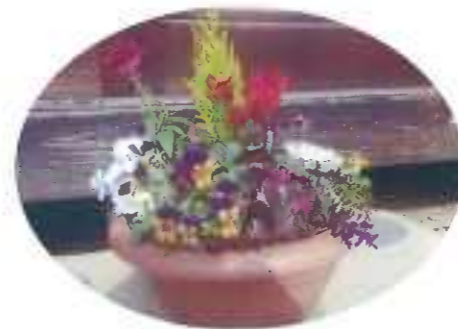
正月用鉢植え盆栽