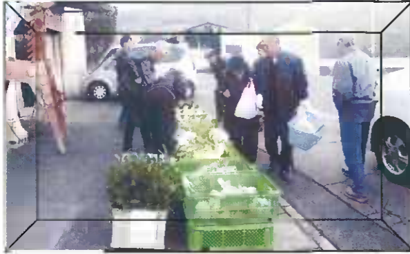
新鮮な野菜やさかき・ひさかきが並ぶ