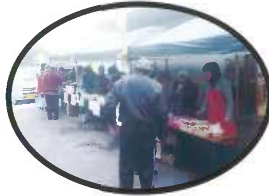
ケーキ・草もち・醤油等加工品が並ぶ