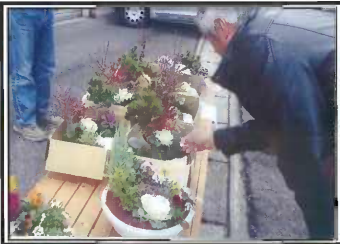
1000円の寄せ植えはすぐ売り切れた