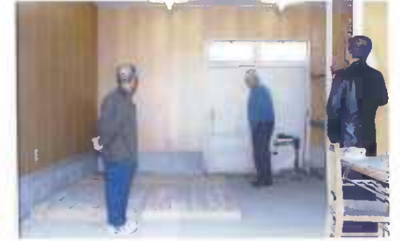
改装前は床がコンクリートだった

有田集会所と旧消防機庫とに挟まれた旧農協の建物を譲り受け、陶山まちづくり協議会の事務所として使えるように改装している。