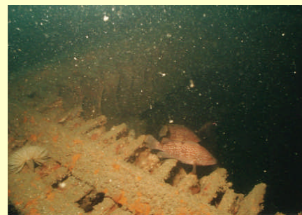
魚礁に定着したキジハタ種苗