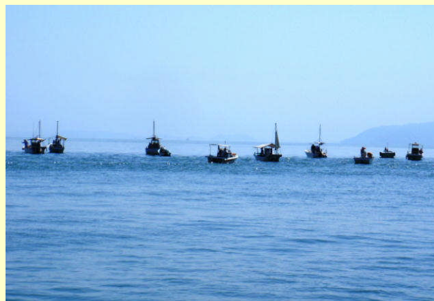
海洋牧場内で釣をする遊漁船

笠岡地区海洋牧場は、水産資源を効率的に増やし、周辺海域に水産資源を供給することを目的として整備した海域ですので、次のとおり利用ルールを定めることとしました。(詳しくは裏面をご覧ください。)