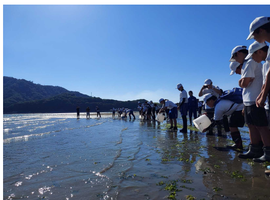
〈保護少年団夏季研修会〉