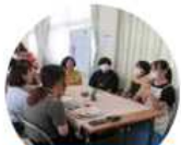
子ども向け活動の支援