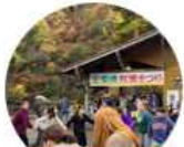
イベントの魅力向上

※活動にあたっては、地域の課題解決などに知見を持った団体がコーディネートするため、経験が少ない方も安心して参加できます