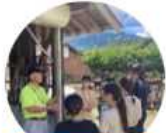
地域と企画・準備