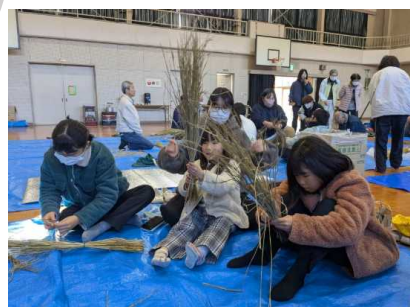
しめ縄づくり教室