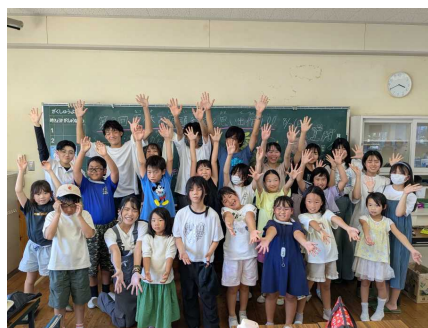
夏休み宿題教室 & 思い出づくり