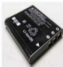
リチウムイオン電池