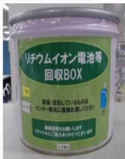
リチウムイオン電池等回収ボックス イメージ