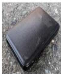
モバイルバッテリー