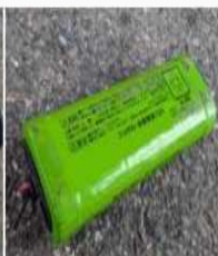
ニッケル水素電池