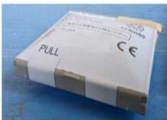
膨張・変形したリチウムイオン電池