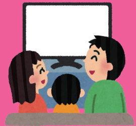
テレビ（かさおか放送）でも