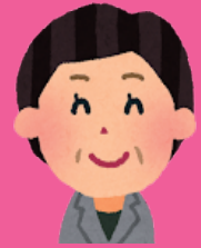
かさおか市ちょう