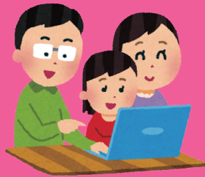
ホームページでも