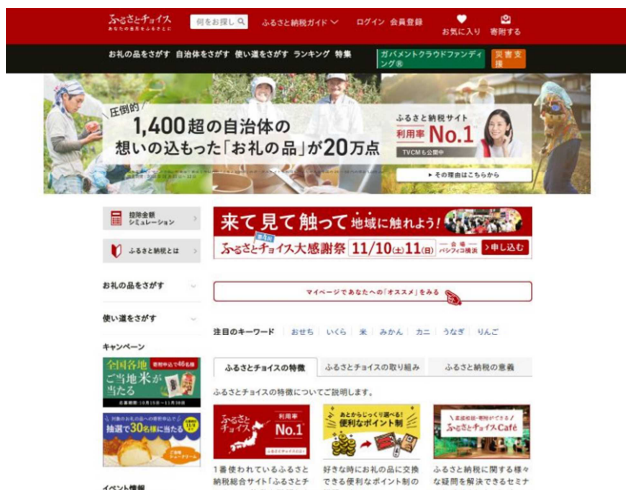
「ふるさとチョイス」トップ画面