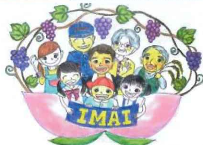
(今井地区まちづくり協議会イメージイラスト)