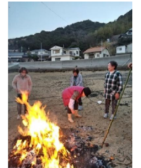
とんど焼きの様子