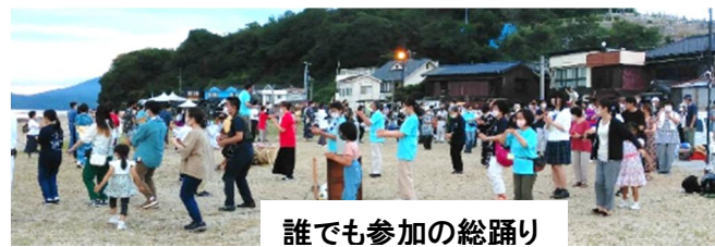
誰でも参加の総踊り

今年も白石踊の季節が始まります。昨年12月「ユネスコ無形文化遺産登録」という称号を頂き、継承に身が引き締まる思いの白石踊会(島民全員)の取り組みです。白石踊会は数年前から、白石踊の継承に危機感を持ち、島民以外の方にも白石踊を広める為、笠岡支部を立ち上げ笠岡市中央公民館で白石踊出前講座を行っています。7月はツアーに向けて、1日(土)8日(土)の2週続けて予定しています。参加は自由です。19:00~20:30白石踊の魅力を感じ白石踊を楽しんでください。