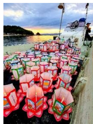
16日灯籠流しと最後の踊