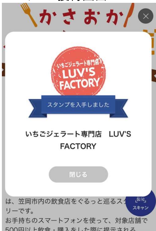
スタンプ獲得画面

は、笠岡市内の飲食店をぐるっと巡るスタンプラリーです。 お手持ちのスマートフォンを使って、対象店舗で500円以上飲食・購入をした際に提示される