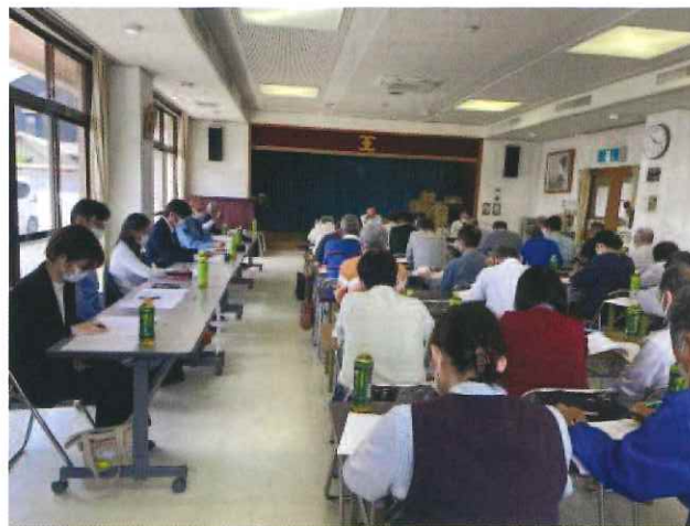
お忙しい中、相談役や顧問に出席いただきました。