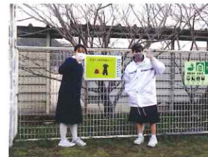
金浦中の皆さんありがとう