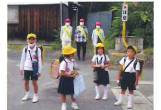
下校時見守りはまかせて