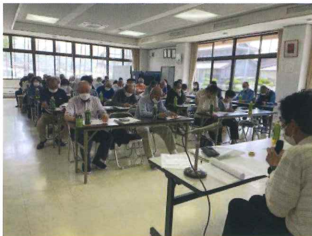
事業計画や収支予算などが承認されました。