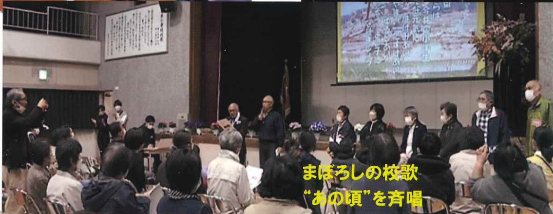
まほろしの校歌 “あの頃”を斉唱