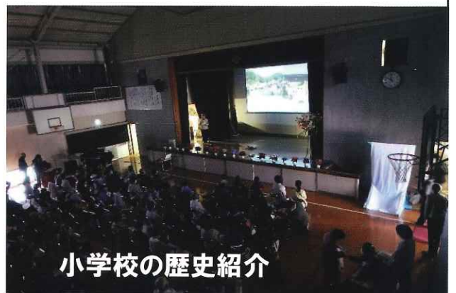
小学校の歴史紹介