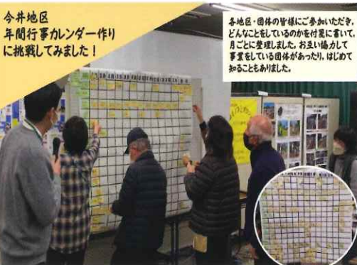
今井地区 年間行事カレンダー作り に挑戦してみました!