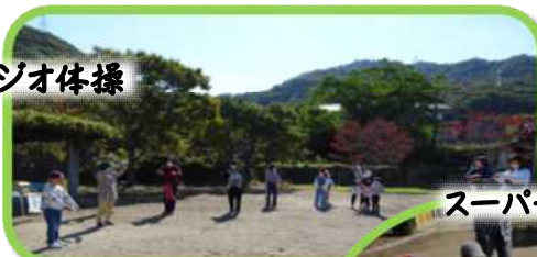
スーパーボール遊び