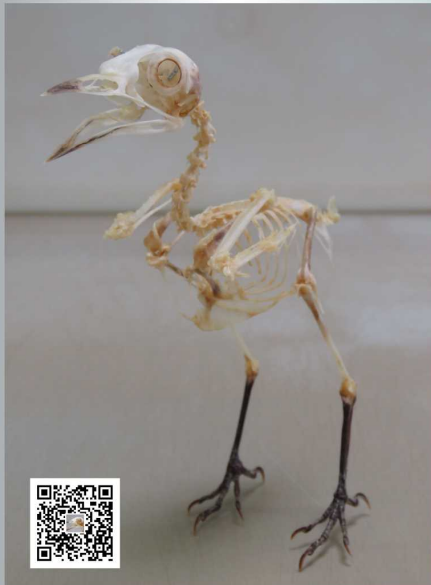
鳥（イソヒヨドリ）の骨格標本の 作り方 YouTube で公開中