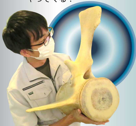
高梁川流域連携中枢都市圏事業