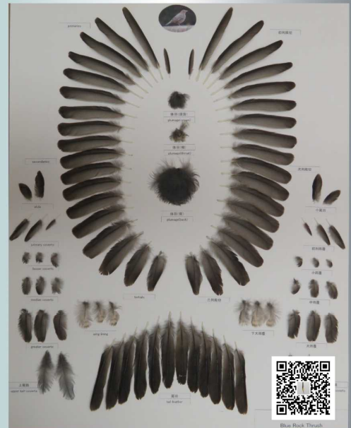
鳥（イソヒヨドリ）の羽根標本の 作り方 YouTube で公開中