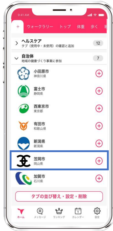
② [笠岡市] を選択