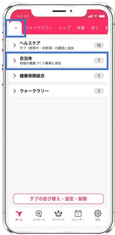
① [+ ] ボタン