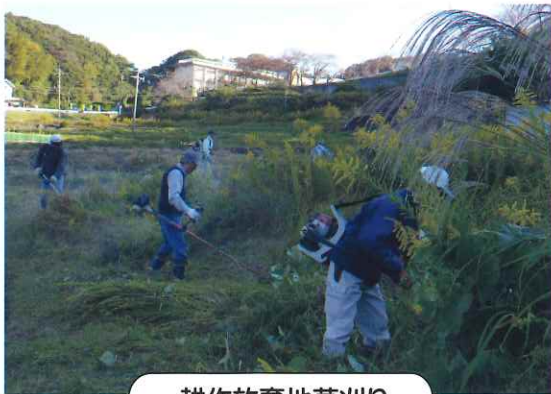
耕作放棄地草刈り