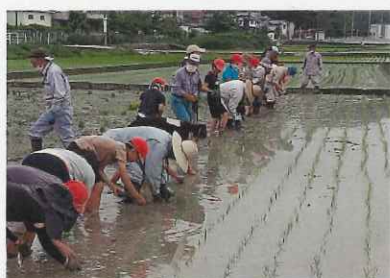
6月22日 田植え 小学5年生を含め46名参加