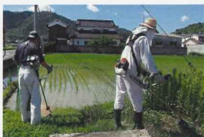
草刈り隊による官地の草刈り