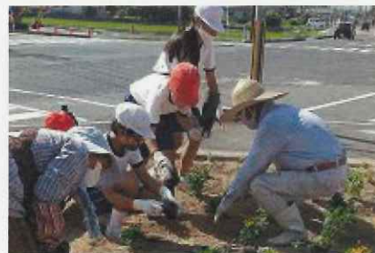
小学生と老人クラブを中心に 小学校前の花壇を整備

お知らせ 自主防災連絡協議会では、9月11日(日)に避難訓練を予定しています。なお当日は、防災サイレン及び一斉放送を実施します。ご協力よろしくお願いいたします。まちづくり協議会は、自主防災活動を支援しています。