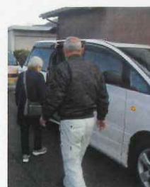
北川号で病院の送迎【随時】

お知らせ 自主防災連絡協議会では、9月11日(日)に避難訓練を予定しています。なお当日は、防災サイレン及び一斉放送を実施します。ご協力よろしくお願いいたします。まちづくり協議会は、自主防災活動を支援しています。