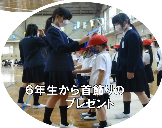
6年生から首飾りのプレゼント