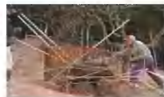
押撫で大型獣捕獲