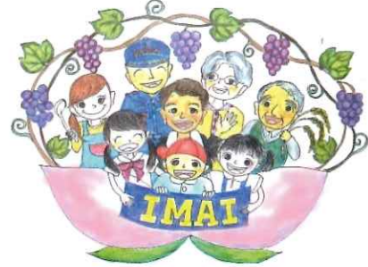
(今井地区まちづくり協議会イメージイラスト)