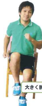
大きく腕も振って