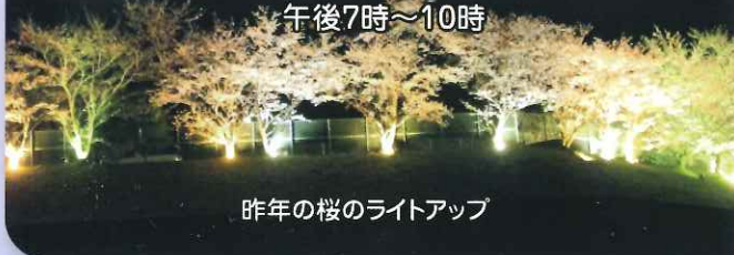
昨年の桜のライトアップ

場所 陶山小学校から陶山公民館西側にかけて 点灯日時 令和3年3月下旬～令和3年4月上旬 午後7時～10時