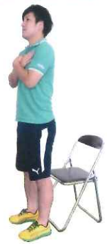
← ← ← ゆっくり腰かける