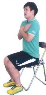
ゆっくり立ち上がる → → →