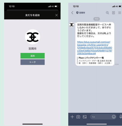
▲スマートフォン操作画面