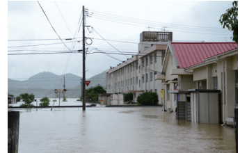
▲特別警報が発表された災害例（平成30年7月豪雨災害）