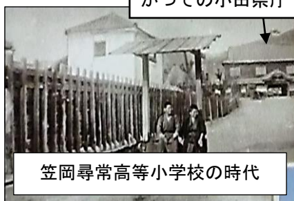
笠岡尋常高等小学校の時代