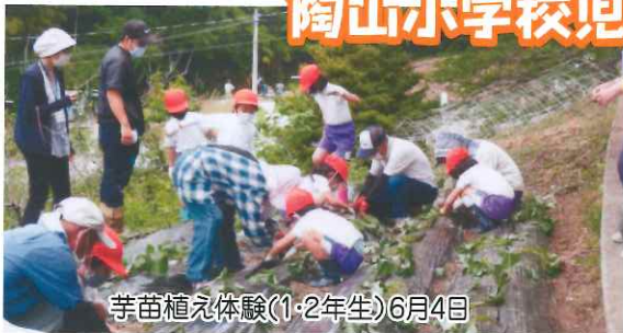
芋苗植え体験(1・2年生)6月4日