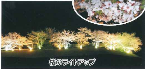
桜のライトアップ

令和2年3月25日から4月17日まで、陶山小学校・陶山公民館沿いの桜のライトアップを行いました。今年は花付きも良く、地区内外から見物に訪れていました。「思ったよりすごかった」と話していました。