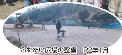
ふれあい広場の整備 R2年1月