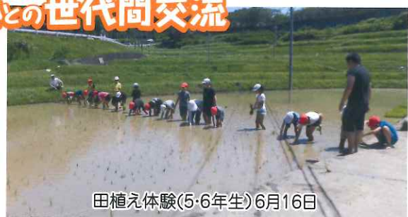
田植え体験(5・6年生)6月16日