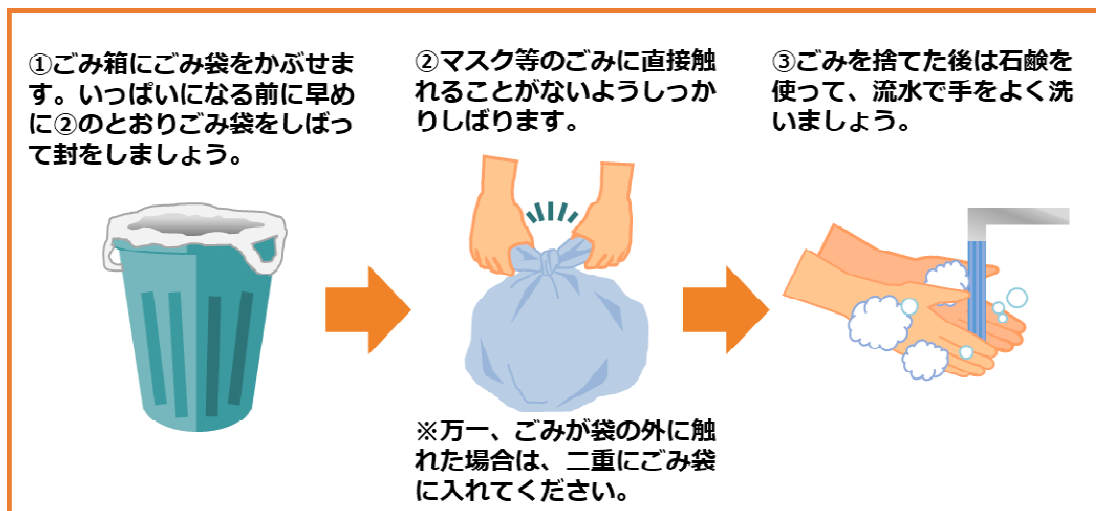
図1 新型コロナウイルス等の感染症の感染者又はその疑いのある方の 使用済みマスク等の捨て方(環境省)