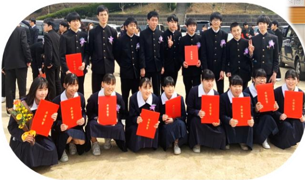
笠岡小学校区の卒業生