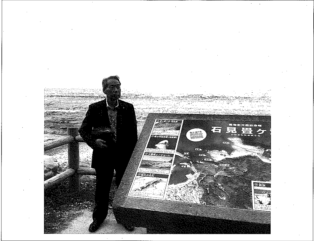
水環境再生山陰ネットワーク会議 関係