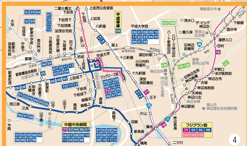
福山市中心部 マップ 7-8P