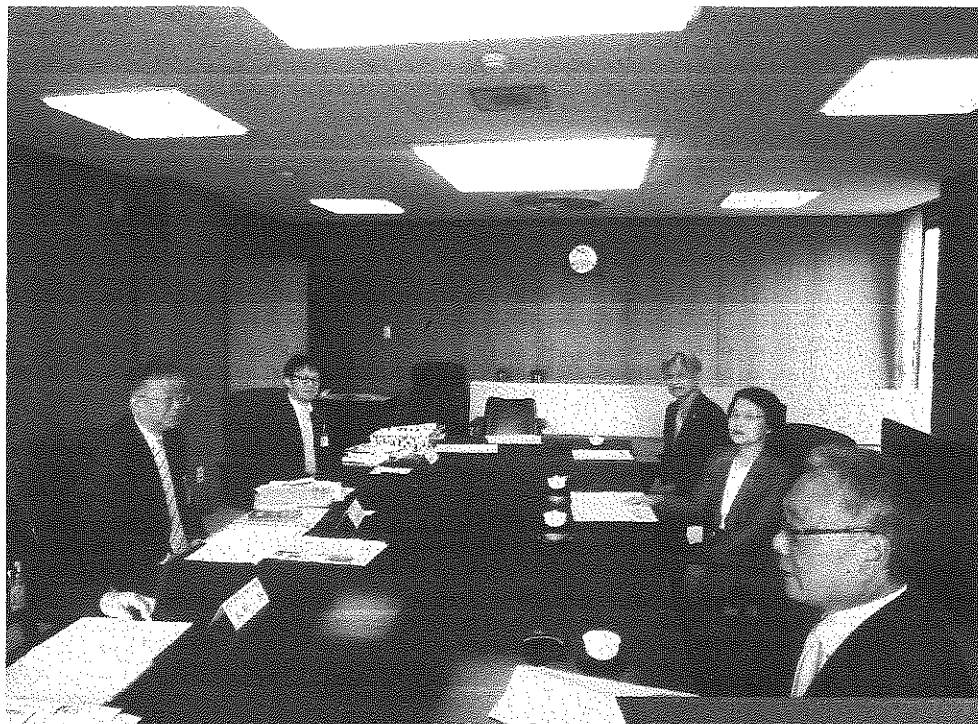
行政視察 H31.4.25 秋田県大仙市