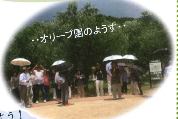
..オリーブ園のようす..