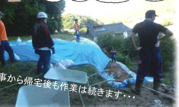
仕事から帰宅後も作業は続きます…