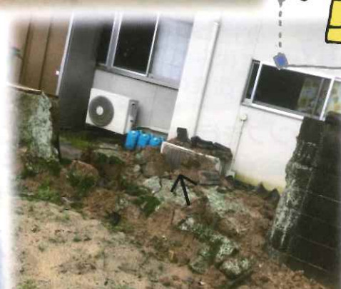
土倉の土塀が崩れて、室外機が泥で埋まってしまいました…