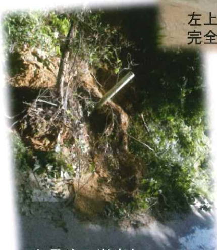
上長迫の崖崩れ 消防団が、通行できるように土砂を撤去しました…

新山地区内でも、自主防災協議会を中心とした災害に向けたしっかりとした組織作りが大切だと思いました。