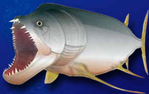
シファクティヌス