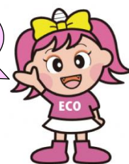
岡山県マスコット「うらっち」