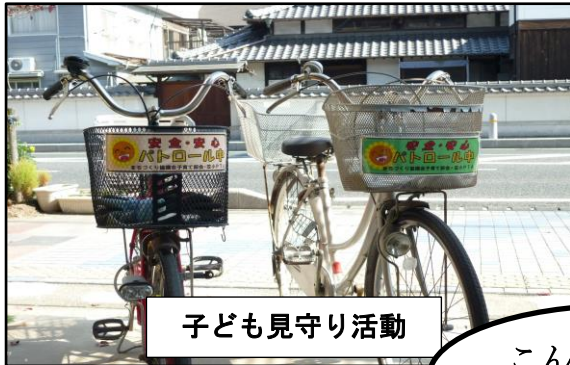
子ども見守り活動

笠岡地区まちづくり協議会では、地域の将来像を形創っていくために、中学生アンケートや大人アンケートの結果を分析しながら課題の抽出を行い、試みに29年度の新規検討事業として計画に掲げてみました。今後は、この計画が住民共通の認識に繋がると共に、一人ひとりが「ふるさと」に誇りと愛着を持ち、既存の地域活動を一層活発に育てながら、誰もが主役として“協働”を実感できる地域の実現をめざして行くために策定する計画です。