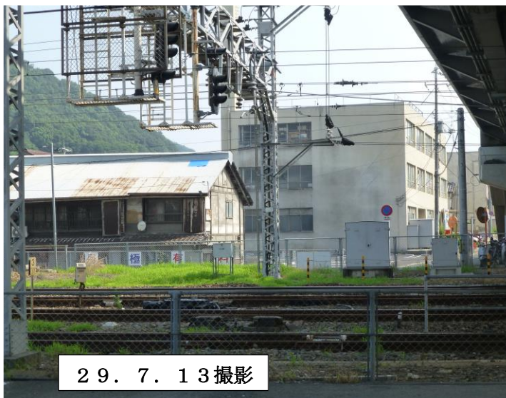
29. 7. 13撮影

昭和30年代前半の西ノ浜踏切、山陽線と井笠鉄道の踏切が同じ場所にあり、その上、貨車の入れ替え作業で閉じられることが多く「開かずの踏切」とも呼ばれていましたが、昭和42年に跨線橋が完成したので踏切は撤去されました。それから50年が経った今年の6月、井笠ボーリングセンターが解体され、奇しくも元郵便局舎(現在は笠岡市役所第2分庁)が国道側から見通せる様になりました。