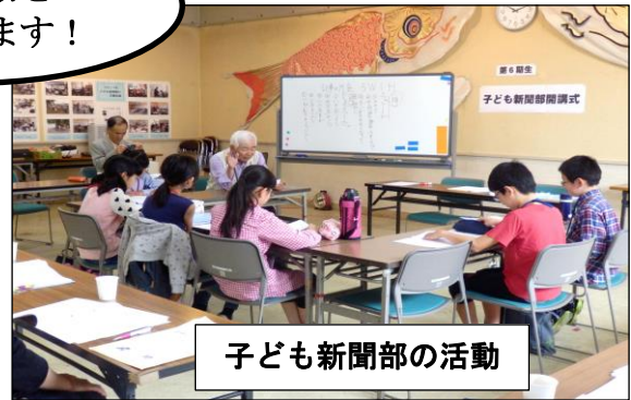
子ども新聞部の活動