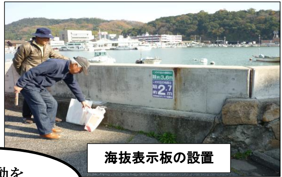
海拔表示板の設置