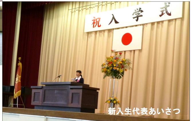
新入生代表あいさつ