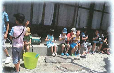
▲いろいろな味の「かき氷」。美味しかったね！