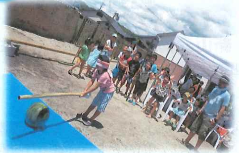
▲応援の歓声で盛り上がった「すいか割り」のようす

七月二十日(月・祝)、土倉屋敷の冷たい井戸水を使って「第四回そうめん流し」を快晴のもと行いました。今年も、たくさんの方が参加があり、8キロのそうめんとアリットルのつゆが無くなりました。そうめん流しでお腹一杯になった子ども達は、すいか割りや水鉄砲、風船で遊びました。また、「にいやま新栄会」特製のかき氷も美味しくいただきました。満足！