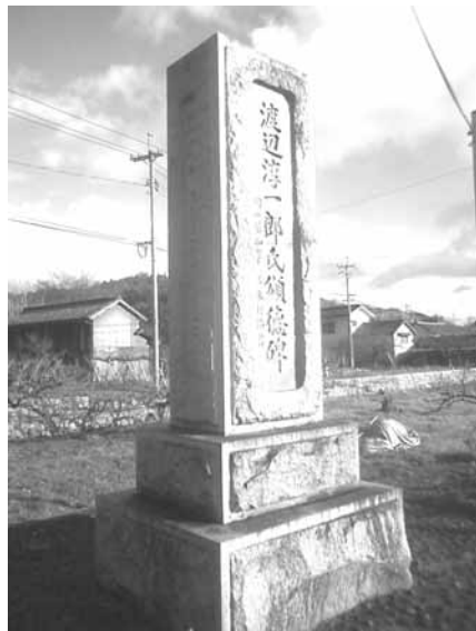
渡邊淳一郎氏頌徳碑 (広浜)

日時 7月18日(月) 海の日 午前10:00~11:30 会場 今井小学校体育館