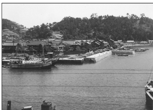
昭和32年頃の住吉港