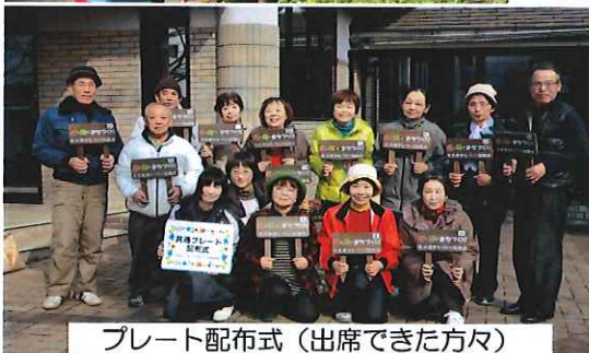
プレート配布式(出席できた方々)

現在の登録メンバーは30名で、個人やグループで、自由な受けち場所をお世話しています。