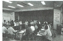
平成25年度通常総会