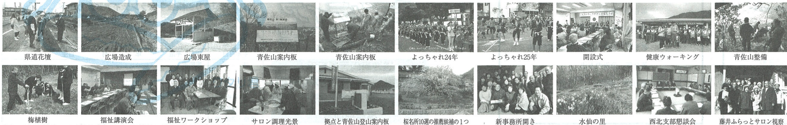
県道花壇 広場造成 広場東屋 青佐山案内板 青佐山案内板 よっちゃれ24年 よっちゃれ25年 開設式 健康ウォーキング 青佐山整備 梅植樹 福祉講演会 福祉ワークショップ サロン調理光景 拠点と青佐山登山案内板 桜名所10選の推薦候補の1つ 新事務所開き 水仙の里 西北支部懇談会 藤井ふらっとサロン視察